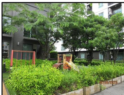
รูปที่ 1-1 (ต่อ) พื้นที่สีเขียวภายในโครงการ